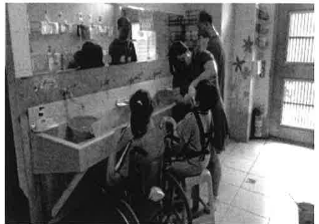
教保人員正執行服務對象之健康照顧