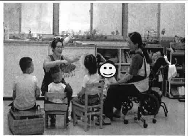
早期療育提供團體或一對一治療課程