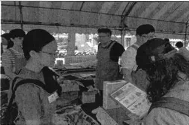
參與園遊會之工作人員