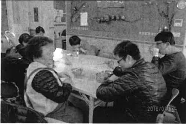
成人身障者用餐情形