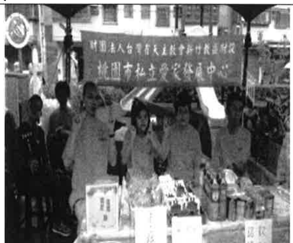
園遊會義賣材料成本