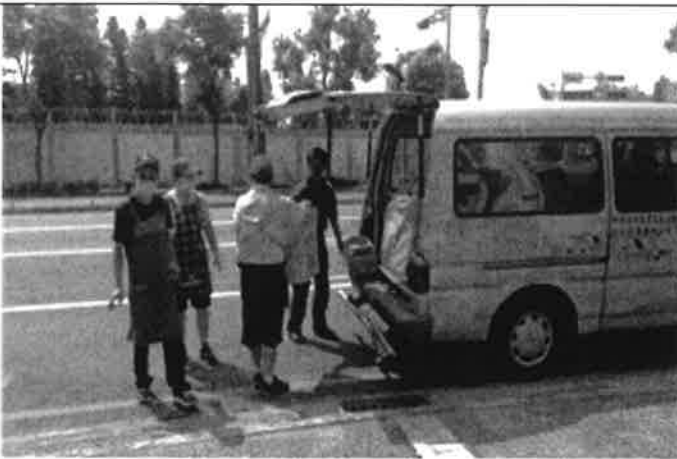
司機與隨車人員載送服務對象上下學及參與活動或是外出打掃