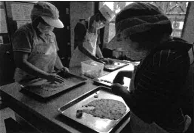
教保人員訓練服務對象烘焙餅乾