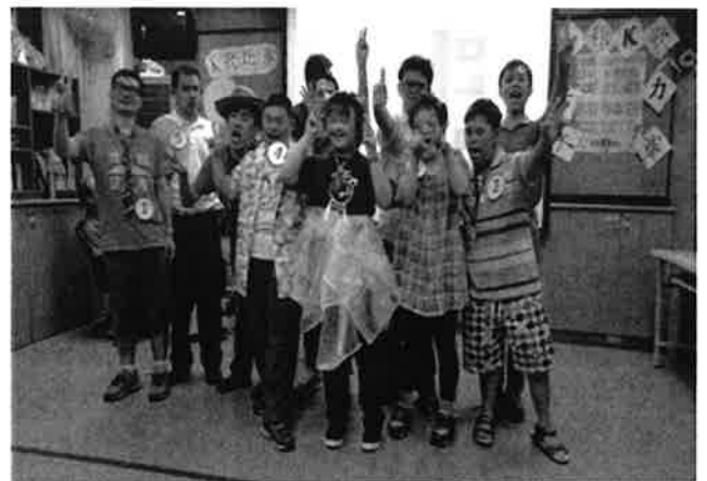
設計卡拉 OK 活動讓服務對象體驗