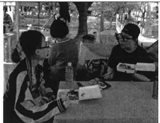
參與園遊會之工作人員