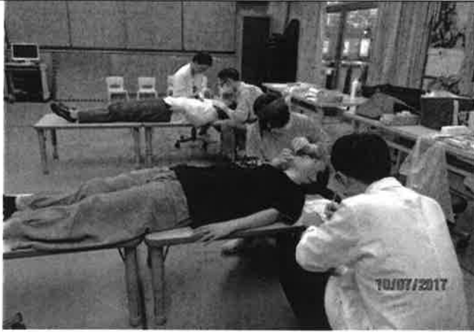
提供成人與學前服務對象檢查口腔及塗氟